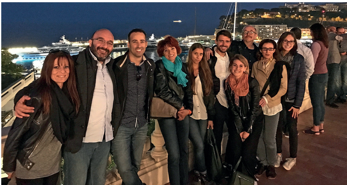
Monaco by night