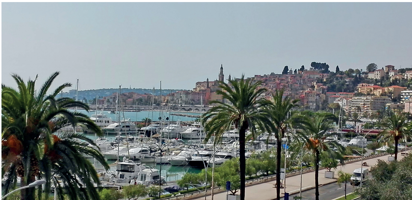
Il nostro albergo a Menton – una stupenda vista sul mare, il porto e la città antica!